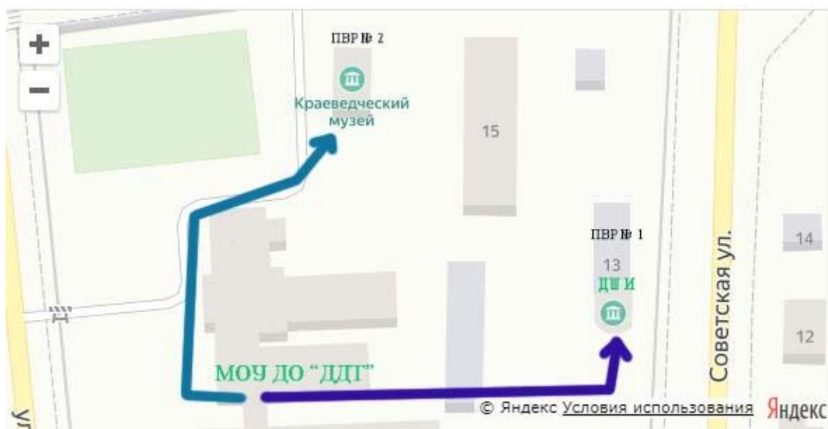
МОУ ДО "Дом детского творчества"